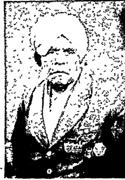
કેઠારી હરગોવિંદ નેચંદલાલ રાજકોટ.